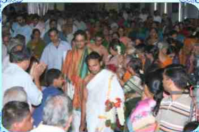
சூல்தலம் பிள்ளைகள் பங்காட்டி ஆராதனை செய்து கொடுத்த சிறவு எடுப்பதில் ஈடுபட்டவர்கள் - (ஜூன் 7-13, 2009)