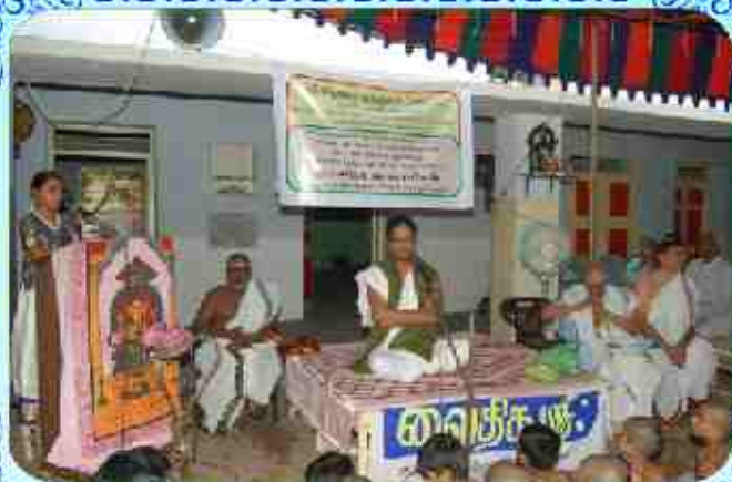
மாணிக்காதி மாநாடு சிறப்பு ஆசிரியர் பிழையாதி நான்கேயாவும் கலந்துகொள்ளும் நிகழ்ச்சி ஊர்க்கிராம அருங்கலை வேத பாலகலை திருவிழா 2009 ஜூன் 7, ஆழ்வார்பேட்டை.