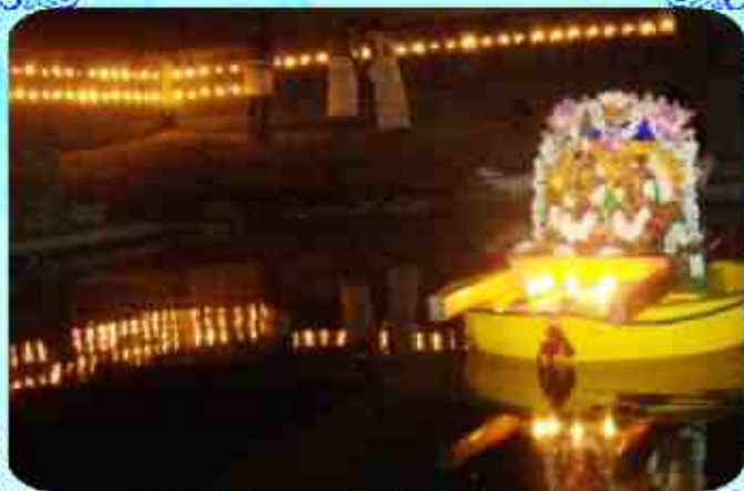
மதுரபுரில் சூல்தலத்தில் நடைபெற்ற நவராத்திரி - (மே24-ஜூன்3, 2009) சிறவு எடுப்பதில் ஈடுபட்டவர்கள்