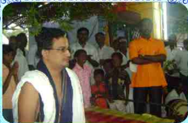
அம்பலமுருகேசுவரர் சமீபத்தில் சிவமயூர்த்தம் கொண்டு சுவாமிநீலகிரம் ஜூன் 3, 2009